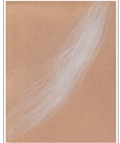
Fibra di mohair

Il mohair viene usato nell'abbigliamento, il pelo del capretto, chiamato kid mohair è usato per produrre tessuti molto pregiati e di grande finezza.